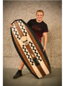
Marc Studerus Schreinerei Fehlmann AG Müllheim Dorf