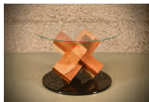
Herzog Küchen AG Homburg

Der Schreiner Ihr Macher schreinerthurgau.ch