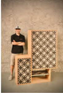
Samuel Friedrich Schreinerei Bantli AG Eschenz