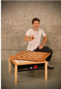
Joan Bosch Schreinerei Nessensohn GmbH Kradolf