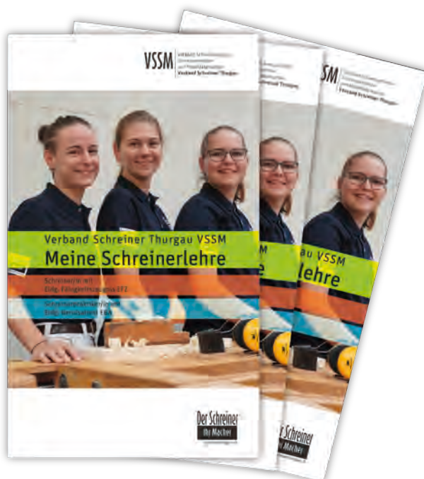
Der Faltprospekt «Meine Schreinerlehre» mit neuem Titelbild.