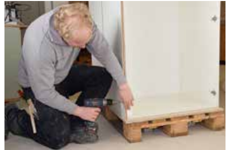
Die Arbeitnehmer der Schreinerbranche können sich im Jahr 2020 auf mehr Lohn freuen.

Mit der nun beschlossenen Lohnregelung können die Verhandlungen um den Gesamtarbeitsvertrag (GAV) im 2020 fortgesetzt werden. Der Fahrplan der VSSM-Verhandlungsdelegation sieht vor, dass die Präsidenten der Sektionen und Fachgruppen im Frühling 2020 und die Delegierten im Sommer 2020 über die nächsten Schritte auf dem Weg zum neuen GAV befinden können.