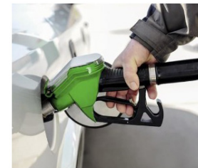
Schreinereien profitieren von einem tieferen Literpreis an BP-Tankstellen.

Der Verband Schweizerischer Schreinermeister und Möbelfabrikanten (VSSM) kann ab sofort zusammen mit dem Öl-Unternehmen BP seinen Mitgliedern vergünstigten Treibstoff anbieten. VSSM-Betriebe profitieren von einem Rabatt von 6 Rappen pro Liter Benzin oder Diesel an sämtlichen 350 BP-Tankstellen in der Schweiz und im Fürstentum Liechtenstein. Für Erdgas gilt das Angebot nicht.