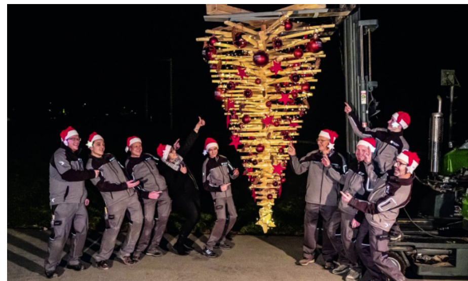
Erster Rang für den kopfüber hängenden Baum der Schläppi Innenausbau GmbH in Lenk BE.

Schreiner-Weihnachtsbaum. Die Jury hat gesprochen: Der kreativste Weihnachtsbaum stand beziehungsweise hing im Berner Oberland. Gewinner oder nicht, alle Bäume machten beste Werbung in eigener Sache.