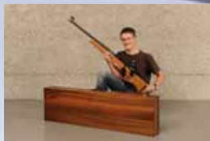
Adrian Widmer Lemmenmeier GmbH