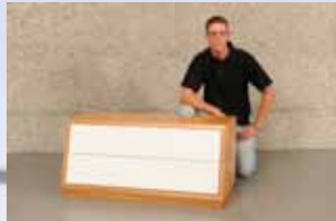
Dominik Wellauer Engeler + Frei Schreinerei GmbH