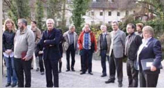
Empfang in der Kartause Ittingen