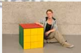
Tanja Stoller Rutishauer Innenausbau AG