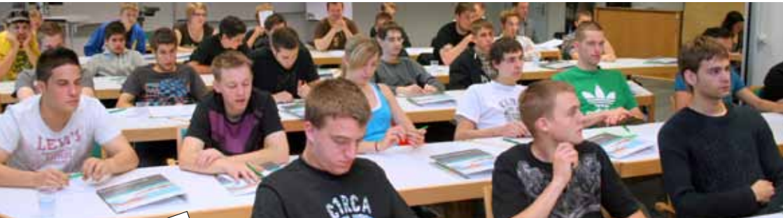
Seminar für Lehrgänger "Der Schritt ins Arbeitsleben - Auf zu neuen Ufern"