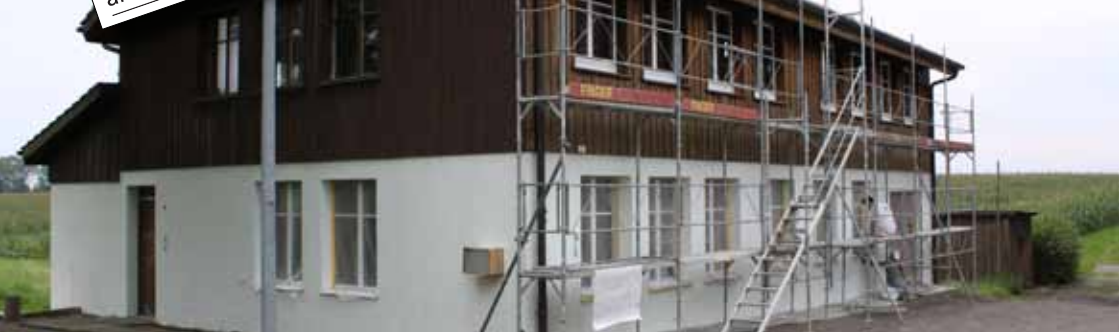
Renovation Kurszentrum Klingenberg