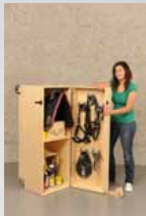
Kerstin Koch Krattiger Holzbau AG