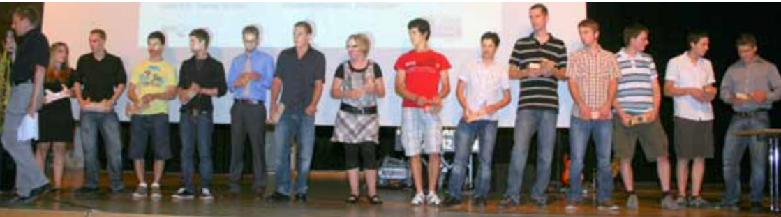
Lehrabschlussfeier in Märstetten

Die Auswahl der Bilder zeigt einen Ausschnitt der Verbandsaktivitäten 2010 und hat keinen Anspruch auf Vollständigkeit. Über viele Anlässe des Verband Schreiner Thurgau VSSM haben wir an diese Stelle bereits ausführlich informiert. Weitere Hintergründe in Bild und Text auf www.schreinerthurgau.ch .