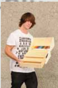
Rafael Haubensak Kaufmann Oberholzer Schönenberg AG