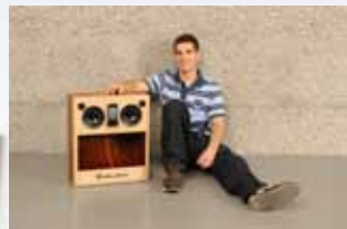
Silvan Bartholdi Steiger Schreinerei