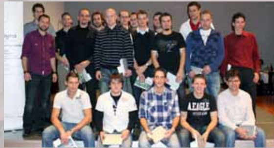
Geehrte Weiterbildungsabsolventen aus dem Thurgau