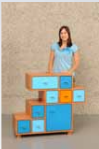
Nadine Albrecht Furter AG