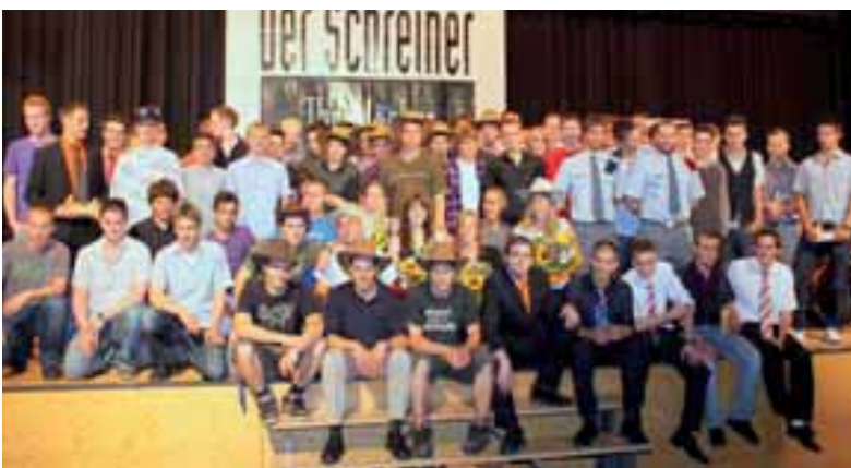
LAP-Feier in Märstetten