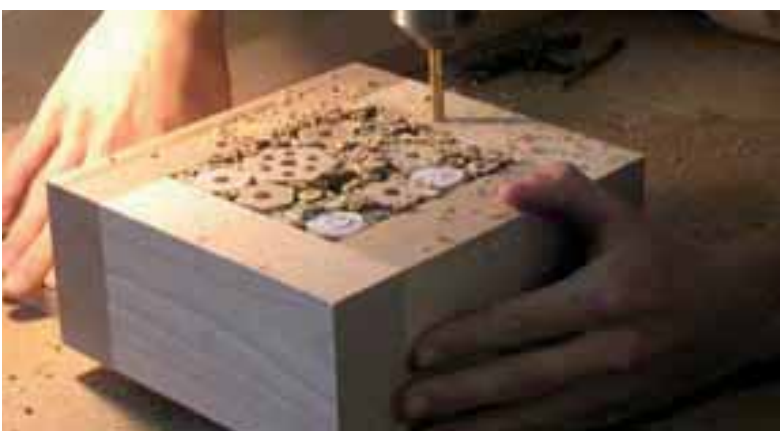
Gotte-Götti-Tag (Wildbienenhotel) PR-Aktion VSSM