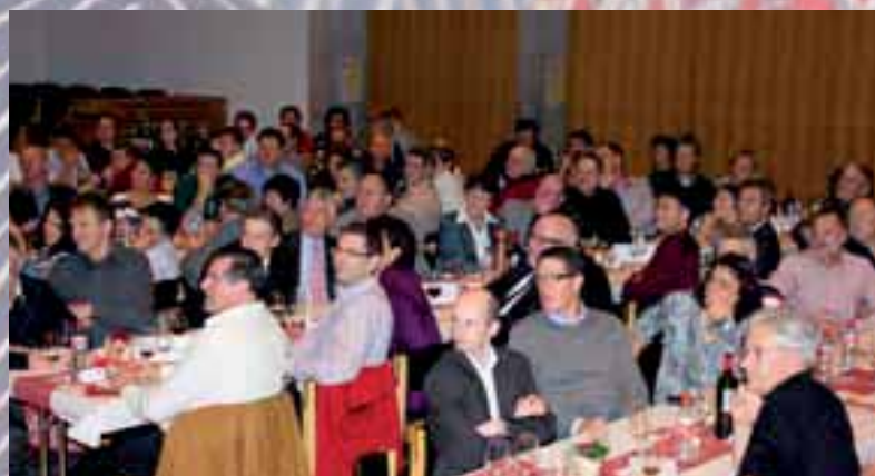
Sichtlich interessierte Besucher an der a.o. Generalversammlung in Bottighofen