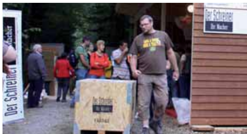
Thurgauer Waldtage, Frauenfeld