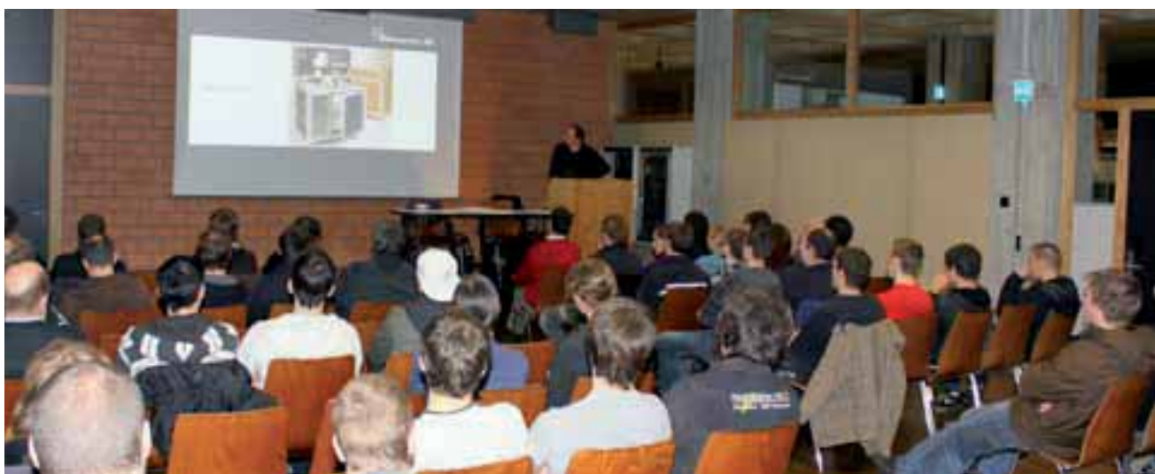
Grosses Interesse zum Auftakt des Lehrlingswettbewerbs 2010 (Elements 10) anlässlich der Informationsveranstaltung vom 7. Dezember 2009

Der Verband Schreiner Thurgau VSSM und die Verantwortlichen der Elements 10 freuen sich heute schon auf eine rege Teilnahme und eine breitgefächerte Vielfalt von Ausstellungstücken anlässlich der Wega 2010 an der auf anschauliche Art und Weise das Thurgauer Schreinerhandwerk mit ihrem Nachwuchs präsentiert wird.