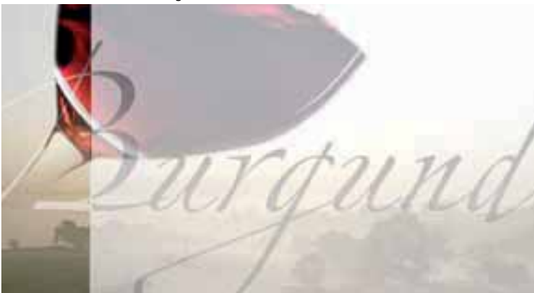
Verbandsreise ins Burgund

Die Auswahl der Bilder zeigt einen Ausschnitt der Verbandsaktivitäten 2009 und hat keinen Anspruch auf Vollständigkeit. Über viele Anlässe des Verband Schreiner Thurgau VSSM haben wir an diese Stelle bereits ausführlich informiert. Weitere Hintergründe in Bild und Text auf www.schreinerthurgau.ch .