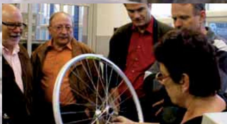
Speichenmontage - jeder Handgriff sitzt!