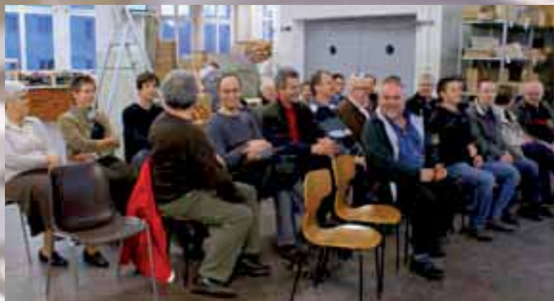
Velointeressierte in den Produktionsräumen der Tour de Suisse, Kreuzlingen