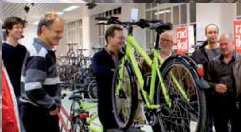
Vorsatz fürs neue Jahr: Ich fahr jetzt mehr mit dem Velo!