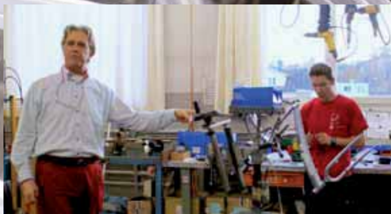
Qualifizierte Mitarbeiterinnen und Mitarbeiter bauen Velos nach Kundenwünschen