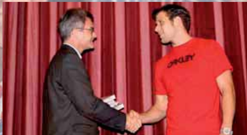
Ehrung von Weiterbildungsabsolventen aus dem Thurgau