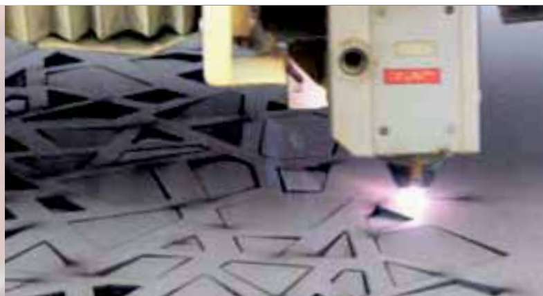
Die BRUAG AG «schneidet» ihre Werkstoffe mit Laser