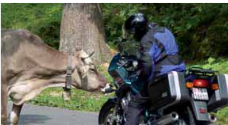
Mitglieder - Töfftour 2009