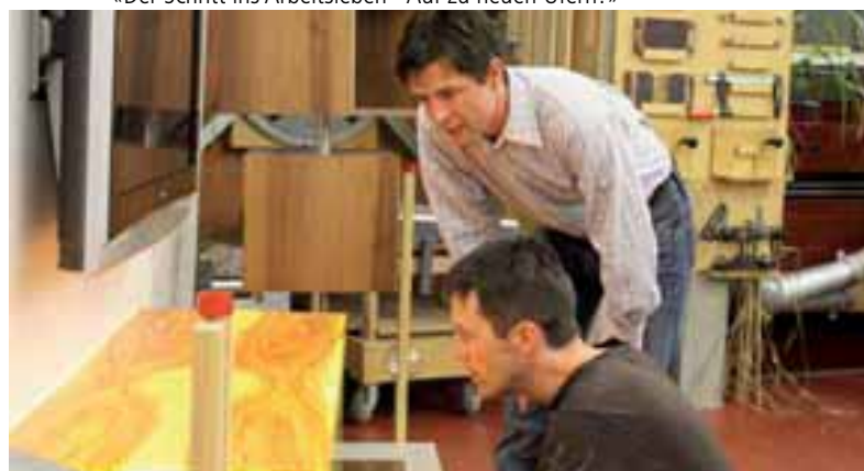
Lehrlingswettbewerb 2009 - Elements 09