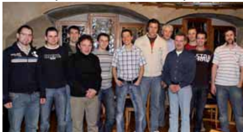
Absolventen VSSM-Module-Weiterbildung GBW, Weinfelden