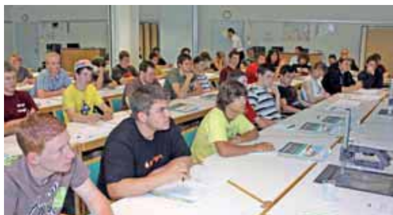
Seminar für Lehrgänger «Der Schritt ins Arbeitsleben - Auf zu neuen Ufern!»