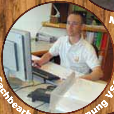
Sachbearbeiter/in Planung VSSM